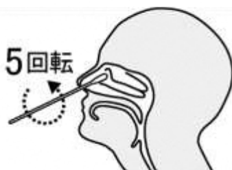
鼻腔ぬぐい液採取